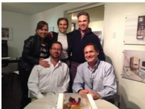
Contamos con un excelente equipo de trabajo para diseñar un proyecto bien hecho.

Iniciamos ventas en el mes de Marzo de 2013 y hoy 6 de Noviembre se encuentran vendidos 13 apartamentos de los 20 disponibles. Esperamos a fin de mes de noviembre iniciar la demolición de las casas existentes, para así dar inicio al proceso constructivo en el mes de enero de 2014. El objetivo es entregar apartamentos en el mes de diciembre de 2014 a los nuevos propietarios.